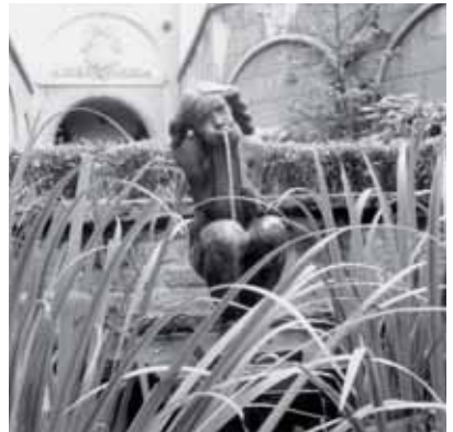
La cracheuse, 1943, Bruxelles