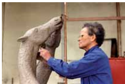
lanchelevici, Maisons-Laffitte, 1990.