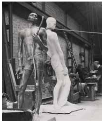
Le Chasseur et le Pêcheur, dans l'atelier de Maisons-Laffitte

ley à Léopoldville figure à l'exposition universelle de Bruxelles. Je les verrai plus tard, tous les trois avec mes élèves. J'apprécierai particulièrement l'air royal du Pâtre et admirerai l'élégance du Chasseur et du Pêcheur. Comme dans ses croquis ramenés du Congo, lan a su souligner la dignité et la prestance que les œuvres d'art européennes attribuaient alors rarement aux colonisés. Par contre, tous ne furent pas du même avis, puisque dans le jardin de Maisons, des élèves d'une école voisine jetèrent des pierres sur l'une des statues d'Africains.