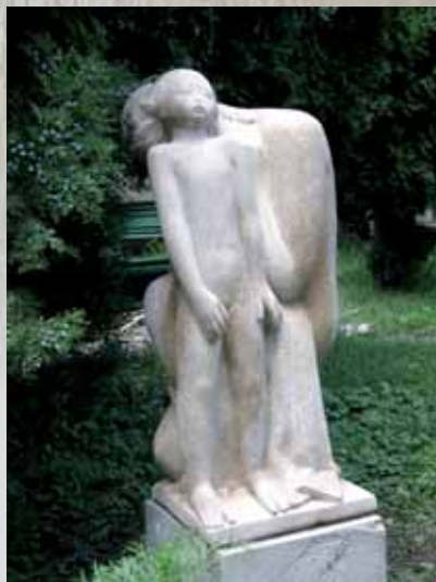
Taille directe au Musée National des Arts de Roumanie à Bucarest