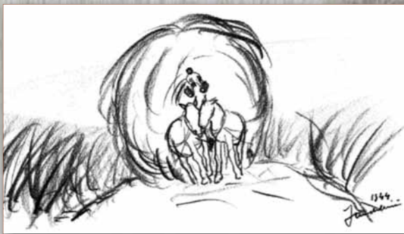
Le Char à foin.

Le 25 juillet, au petit matin, nous quittons Galati. Notre voyage va se poursuivre en voiture le long d'un affluent du Danube - la rivière Prut, que nous allons remonter jusqu'à