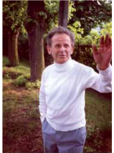
Ianchelevici, Maisons-Laffitte, 1990.