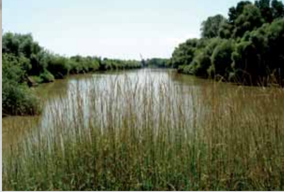
La Rivière Prut à Léova au bord de laquelle jouait lanchelevici enfant.