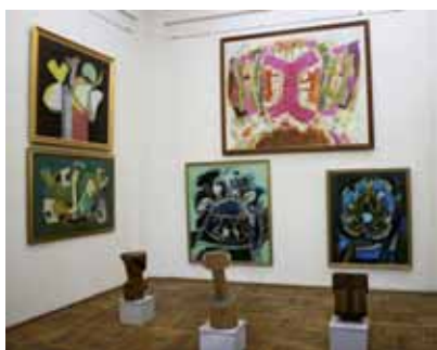
Le Musée d'Art Visuel Galati, les salles d'exposition permanente, art contemporain roumain (Ion Alin Gheorghiu, Ion Pacea – peintures, Napoleon Tiron – sculptures)

Le Musée d'Art Visuel de Galati est le premier musée d'art contemporain fondé en Roumanie depuis 1967. Sa vocation est de présenter les tendances plastiques les plus novatrices du XX e siècle.