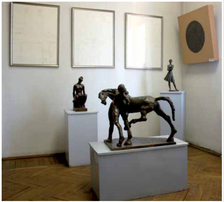
La salle «Ianchelevici» au Musée d'Art Visuel Galati

La donation d'œuvres consentie par Ianchelevici en 1992 au Musée d'Art Visuel de Galati occupe un espace de choix dans le parcours permanent de cet important musée abritant une vaste collection d'art moderne roumain et de créations contemporaines roumaines de 1967 à nos jours. Mariana Tomozei Cocos, attachée scientifique de cette institution nous en livre les points forts.